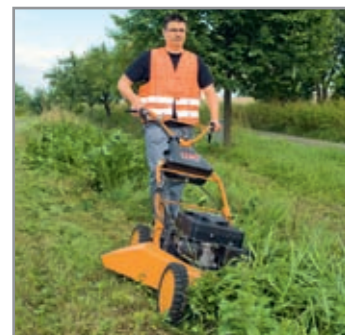
Trazione integrale, il grande aiuto per scarpate e dossi.