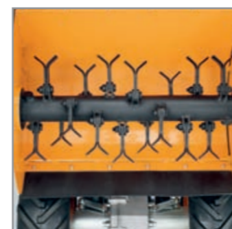
Gruppo falciante inseribile con coltelli singoli snodati.