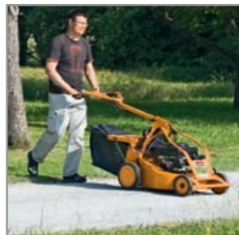
Arresto lama antipietrisco

Carter coprilama parasassi e struttura particolarmente stabile. La potenza di un motore a 2 o 4 tempi AS, la regolazione continua della velocità, le ruote di grandi dimensioni per una trazione ottimale e la tecnologia che richiede pochissima manutenzione consentono all'utilizzatore di avere sempre il meglio. A richiesta con arresto lama.