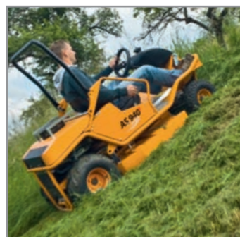
Fino ad una pendenza di 15° per la guida trasversale

Una regolazione laterale particolarmente semplice del piantone dello sterzo è d'aiuto nelle forti pendenze anche lungo le recinzioni e le pareti domestiche per guidare facilmente la tosaerba.