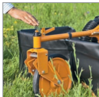
Semplice arresto della ruota anteriore per la guida in rettilineo, trasversale rispetto alla pendenza

Per tutti i lavori di tosatura in grandi prati con erba alta. Con un robusto gruppo di taglio e per il mulching. Grazie ai filtri sulle prese d'aria queste tosaerba Allmäher® possono lavorare anche laddove ad altri modelli manca l'aria a causa dell'erba alta. I pneumatici sono dotati di camera d'aria e hanno un battistrada per uso agricolo. Offrono un'ammortizzazione confortevole contro le vibrazioni, cambio a due marce, freno sulla ruota posteriore e una ruota anteriore sterzabile per un'eccellente manovrabilità.