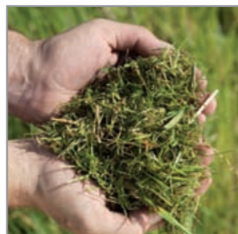
Erba sminuzzata per la guida trasversale