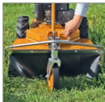
Semplice regolazione dell'altezza