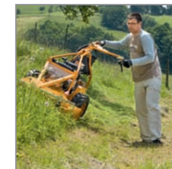
90° di rotazione a sinistra e a destra