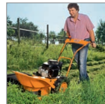
Il rastrellamento è eliminato: deposito dell'erba falciata in un'andana durante la falciatura.

Un'alternativa economica che richiede pochissima manutenzione rispetto alle motofalciatrici a barra. La rotofalce è un'invenzione particolare per coloro che utilizzano l'erba non sminuzzata per la produzione di mangime. L'erba viene depositata lateralmente in un'andana. Non richiede il rastrellamento, soltanto il caricamento in fila.